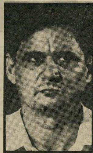
שר ארידור משחק אותה