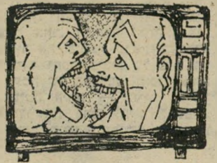
יוסי מכה את יוסי

מסע-הצלב שניהלה הממשלה כ- נגד הטלוויזיה הינו דוגמה נוספת למחשבה שכלי-התיקשורת הם ה- אשמים בכל, אשמה שכלי-התיק-