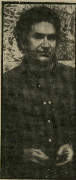
ג'ורג' שמש סטודיו בניו-יורק

ג'ורג' שמש הוא טיפוס חס-דמוג כמו ציוריו. כשנסעתי לפאריס — היה זה קץ נישואי הראשונים, יב-שנסעתי לניו-יורק — הסתיימו נישואי השניים, הוא מספר, בעיר הגדולה. במכה של האמנות, הוא התגורר תחל מהיום הראשון במלון צ'לטי המפורסם, שההיסטור-יה המפוארת של אורחיו כוללת תחל מראשית המאה את גדולי ה-תיאטרון, הספרות והאמנות. שרה ברנר, אוסקר ווילד, אר-תור מילר, יוג'ין או'ניל, או הנרי, הציירים לארי ריכרס, וויליאם דה קונינג, סם פראנסי-ס, (שבסטודיו שלו ממש, מצ-ייר ג'ורג') והקולנוען מיליט-פורמן. במלון זה גרו גם לאה ניקל, בשנים שהתגוררה בניו-יורק, והצייר המנוח מאריאן, עי-למותו המיסטורי. לשנים האחרונות, שבהן התגורר שמש במלון צ'לטי, הוא קורא שנות צ'לטי. האמן אנרי וורהול צילם את הנערות היפות המסתופפות במלון, וקרא לסרט נערות צ'לטי.