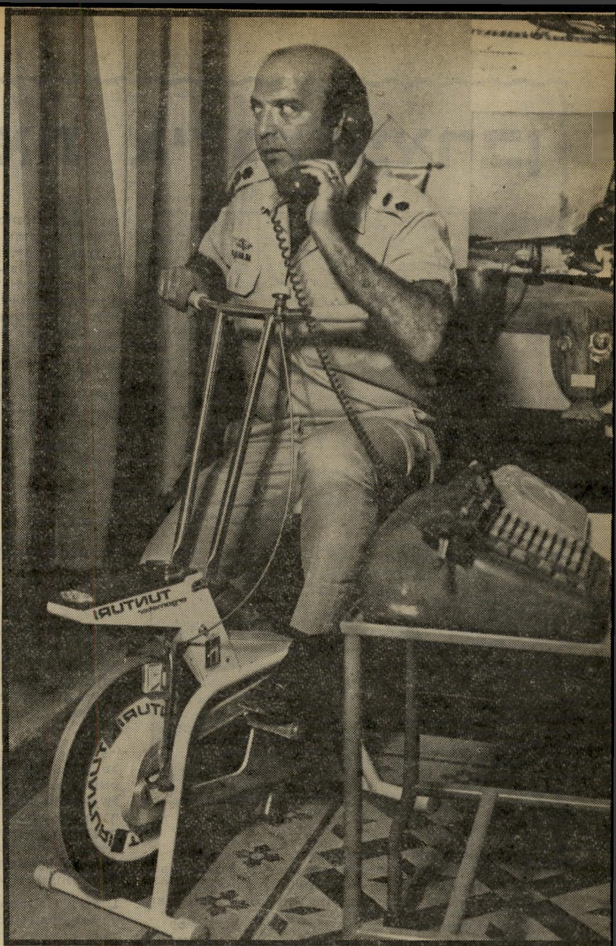
מפקד התחנה כך נראה מפקד תחנת השידור הצבאית בטרט לא לשידור, במשרדו, כשהוא מטלפן ומאמן את רגליו ברכיבה על אופניים. אנשי גלי צה"ל לשעבר התקשו להצביע על קשר לדמות אמיתית.