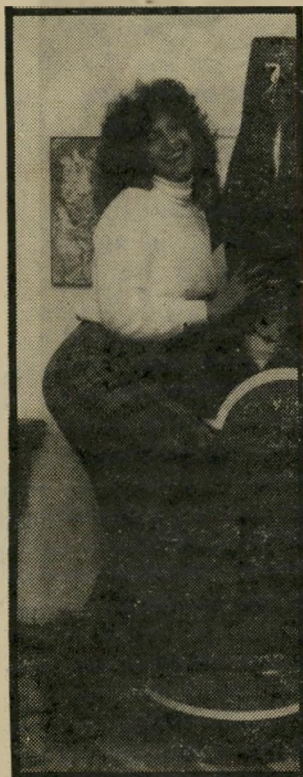
ביוגרפיה פינגטית בת-מושכ יהודמי

קורא חשוד, שראה תצ- לום של אשה בלבוש חווה, מטיל ספק באמיתות ה-