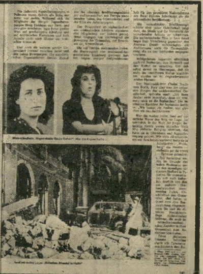
אשת השנה גאולה כהן תחושת שליחות, בוערת, חוסר-פשרנות מסוכן

בהקדמה לכתבה, הנושאת את הכותרת "אני, לוחמת יהודיה", כותב השבועון הגרמני: "היא שיסעה את דברי ג'ימי קארטר בעת נאומו בכנסת. היא גורשה בכוח מאולס-המליאה. היא הגישה את חוקי-ירושלים השנויים במחלוקת ודחפה את ראש הממשלה הימני מנחם בגין עוד יותר ימינה. זוהי גאולה כהן, 55, מנהיגה של סיעה ימנית-קיצונית בת שני חברים ב-פרלמנט הישראלי. היא דוגלת בשוביניזם יהודי, ומרחיקה-לכת אף לטעמו של בגין הקיצוני. היא קנאית בעלת תחושת-שליחות בוערת וחוסר-פשרנות מסוכן. אורי אבנרי, העורך הראשי של השבועון העולם הזה ועד לא-מכבר חבר-כנסת ליברלי-שמאלי, מתאר את ז'אן דארק ישראלית זו."