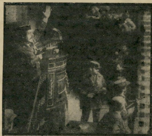
פאשיסטים בקורטז הספרדי הד גם בפורטוגל

המפלגה שתיערך במאי, ולהיות מועמד בעל סיכויים רבים בבחירות לנשיאות ב-1985. הקומוניסטים, לעומת זאת, נבחרים על פרופיל נמוך. כישלונם היחסי במחירות נבע בעיקר מהאוריינטציה הפרו-סובייטית הקיצונית שלהם. פרשת פולין הביכה אותם מאוד. כל איש שמאל פורטוגלי תומך, ממש אוטומטית, במאבק של איגודים-מקצועיים, מנהיגות המפלגה נאלצה להכריז על תמיכתה במגמות של סולידריות, תוך ביקורת מסוימת על טקטיקה "לא נבונה" של האירגון. לקראת הקיץ עשויה לקום שוב חזית עממית של הסוציאליסטים, הקומוניסטים ואפילו ליברלים תומכי אינס.