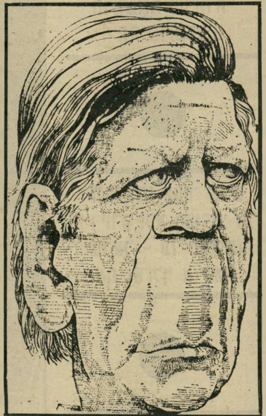
הקאנצלר הלמוט שמידט בעיות מצד שמאל

ההדים של הפיכת-הנפט הפאשיסטית בספרד השפיעו במידה מסוימת על האקלים הפוליטי בפורטוגל השכנה. שתי המדינות סבלו במשך שנים רבות משילטון עריצות ימני, מדיכוי זכויות הפרט ומחיסול אלים של קומוניסטים, סוציאליסטים, ליברלים ופעילי איגודים-מקצועיים. ההלם בספרד היה קצר, אבל משמעותי. הוא הבליט את חוסר השלמתם של היסודות השמרניים עם הדימוי קרטיה, אבל גם את האינטרס המשותף של הבורגנות העירונית המתונה ושל השמאל בשמירת הדימוקרטית. הפורטוגלים היו קרובים מדי למאורעות הסוערים בספרד, מכדי להאמין בשוטיזם הילדותי שנכתבו בעיתונות הישראלית על המלך הגיבור, מצליח הדימוקרטית. חואן קלוס מילא, אמנם, תפקיד חשוב ברתימת