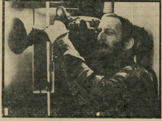
ברבש: ברקיע השבועי יום שני, שעה 9.30 (שידור בצבע)

● בנסון (11.20) — שידור בצבע, מדבר אנגלית . הפרק אבא גטלינג, במקביל לכינוס של מושלים, הנערך בביתו של המושל גאטלינג, מודיע המושל, כי אביו, אבא גאטלינג, עומד ל' בקר גם כן. גטלינג האב מסי' בך את מהלך ועידת המושלים, ומסבך את מערכות היחסים שבין עובדי צוות המושל גט' לינג. סיפור מקביל הוא סר' סור היחסים שבין בתו של המושל, קייטי, לבין הסבא שלה, ובדומה לפרקים אחרים בסדרה זו מתפתחת לה מע' רכת של קונפליקטים, המגיעה