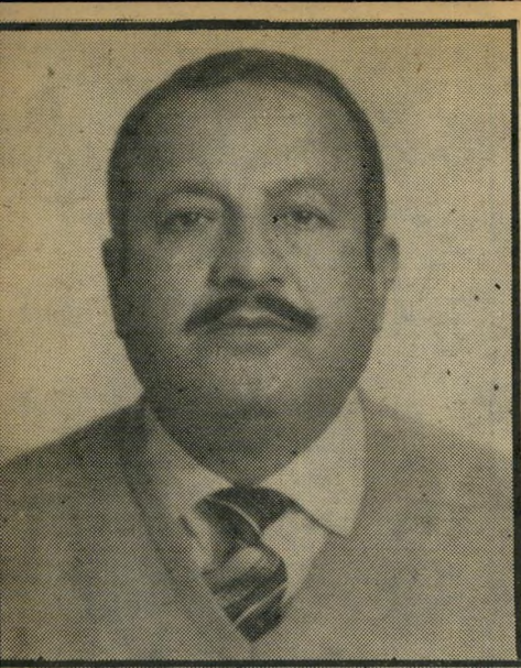
מתנגד קבוב — ועמדה ציבורית

יוכל לממש את שאיפותיו למעמד מכובד ולעמדה ציבורית.