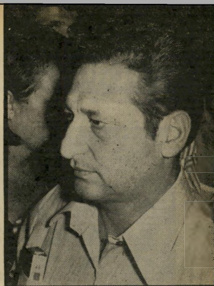
קבנן פרס מעמד מכובד —

אך כאשר יש קשרים בצמרת, אפשר להתגבר גם על בעיות מישפטיות כה מסובכות. יועץ ראש־הממשלה לענייני