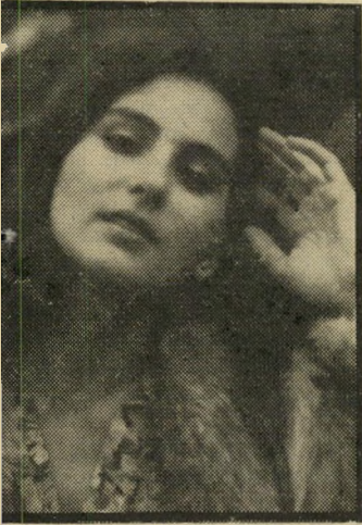
קוראת הררי כתבות חיוביות

אני רוצה לשאול ולתהות: מדוע אתם מפרסמים רק שערוריות כל