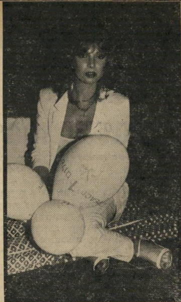
חתיכות לא חסרו אצל אייבי, הן תמיד צמודות אליו. נחה אחרי הריקודים.