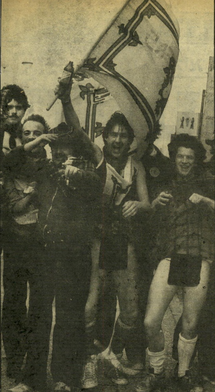
סקוטים מצוינים ערוותם אחרי-הניצחון הכל אהבו אותם, והם אהבו את הכל