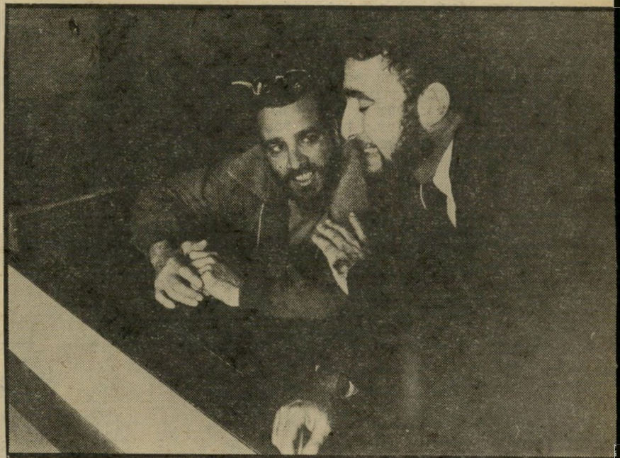
הנאשם וסניגורו בבית-המשפט צריך עדות מטיעת