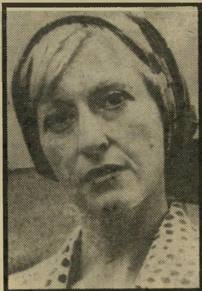
ברברה רוז שתיקה רועמת כמחאה

בשבוע שעבר הגיעה לכאן הישר מניו יורק תערוכה של אחת מה"היסטוריונים החשובים של האמנות, ברברה רוז האמריקאית, ועימה ההוכחה החותכת לכך, שכל מה שנעשה בעשור שחלף היה רק