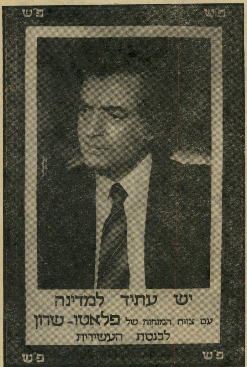
יש עתיד למדינה עם צוות המזחות של פלאטו- שרון לבנסת העשירית

ואילו אני, מה לעשות, נשארתי עם העקשנות הטיפשית שלי. תכניסו לי כמה כוסיות שרק אפשר, תגלגלו אותי בבוץ ותורידו לי אוזן, ולא תשמעו ממני מילה טובה על דיין או על המערך. הם שניהם נופלים ב"50% שבהם אני תמיד צודק. וזה גם מה שאמרתי לחבר ההוא שלי. אין לי כוח לספר כאן כל מה שאמרתי לו, אבל מה שברור הוא שלא רק אני נשארתי עם העקשנות הטיפשית שלי. גם הוא. בדיוק מה שעשה לפני ארבע שנים הוא הולך לעשות בעוד כמה חוד"שים. ניפגש כאן שוב בעוד ארבע שנים.