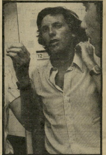
כתב סממה במדינה אחרת