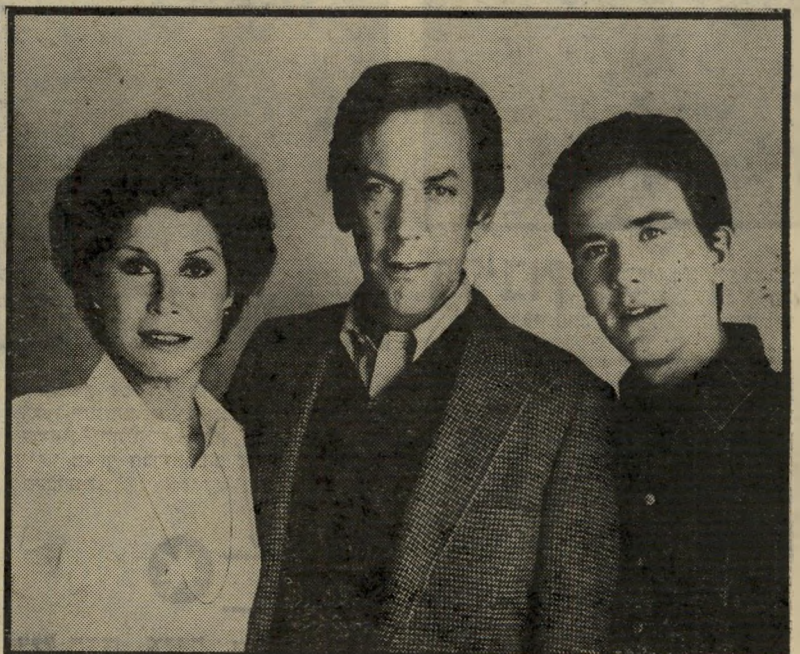
טים האטון, דונאלד סאתרלנד ומרי טיילור-מוור