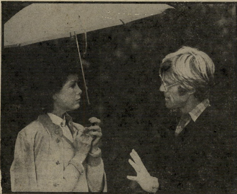
רוברט רדפורד מביים את מרי טיילור-מוור