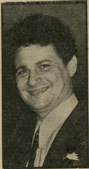
שר-אוצר ארידור סתם יום של חול

באפטיסית האמריקאית, צודק ב- אימרתו האנטי-שמית המצוטטת ב- רבים: "אלוהים אינו שומע ל- תפילות היהודים." יוסף שריק תל-אביב