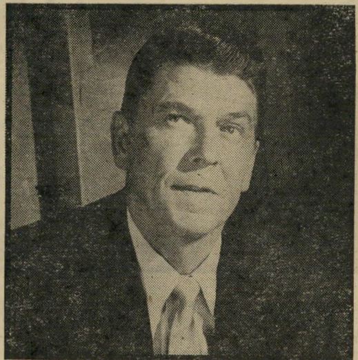
נשיא רונאלד רגן דוגמה רעה

* פשיטות-רגל — המליצה החביבה על תאצ'ר היא: "יש לת לכשירים ולחוקים להיוותר בחיים, אין לסייע לחלשים באורח מלאכותי". פילוסופיה ספארטנית זו, המקובלת גם על רגן, הביאה לפשיטות-רגל של 10