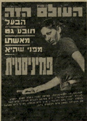
שער "העולם הזה" 2253 הסכם זוגי מפורט

לדעתי, כדי למנוע בעתיד סיכ' סוכים כנ"ל וכדי לבחור בחיים של שיויון אמיתי וצדק חברתי, ה' פתרון הוא זה: הסכם זוגי מפורט לפני הגישוין, שיכלול, בין ה' שאר, תיאור עיסוק והגדרת סמ'