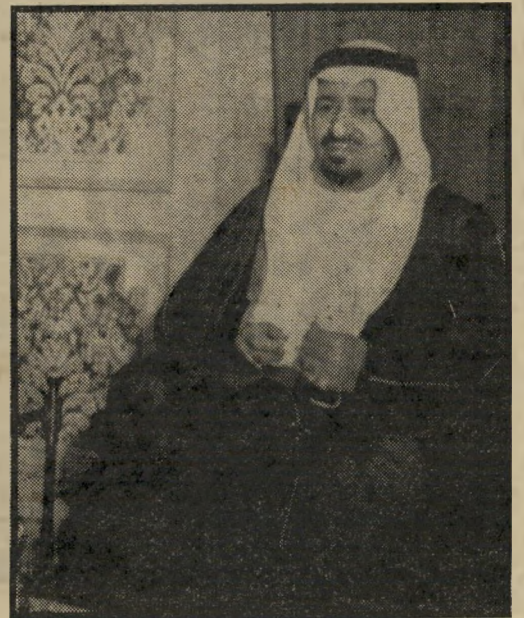
מלך סעודיה הארד בראש סדר העדיפויות

מדובר בנתונים רישמיים של מכירות נשק אמריקאיות לארצות שונות. הנתונים ספקו עליידי מישרד-הביטחון (ההגנה) האמריקאי בכבודו ובעצמו, הם מתייחסים ל-שנת התקציב 1978. יותר ממצאות מארים ארוכים, דרך שות צדקניות והוגאה עצמית, הם משקפים את מגמות מדיניות החוץ של ארצות-הברית, ואת החשיבות האסי-