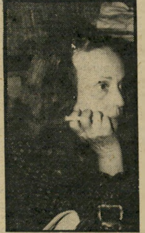
מורו: זכרונות מצרפת יום רביעי, שעה 10.05

חלוצי החלל (6.15) — שידור בצבע , פרק נוסף בסידרה של מדע-בידיוני. הצוות מגיע אל התותח ומשמיד אותו ואת הבסיס שמסביבו. אנשי גאמילון נאלצים לנטוש את הכוכב פלוטו, וה-