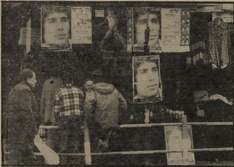
אחת החנויות השדודות: התחנה המרכזית אולפן הקלטות פרימיטיבי

תעשיית התקליטים: "עוד בתאריך 4.10.77 הוגשה תלונה למישטרה. נמסרה להם קסטה פירטית, שנקנתה מאדם מסויים, שנחשד שהוא פוסק בזה. קיבלנו צרחיפוש, מצאנו קסטות ומסרנו אותן לבדיקה במישטרה, כדי להוכיח שהן אינן חוקיות, כן מסרנו חוות-ידעת מישפטית על עניין זכויות-יוצרים. המישטרה לא מצאה, לדבריה, מספיק ראיות, אף-על-פי שפרשת הקסטות היא עבירה מפורשת על החוק, והיום