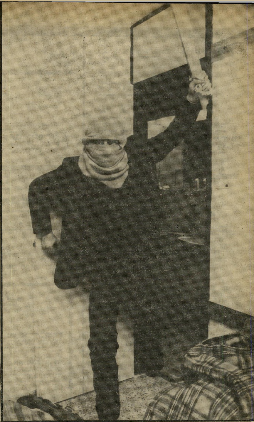
לחדריהם של הסטודנטים הערביים במעונות שבטכניון (שיחזור). ברשות התוקפים היו המפתחות המתאימים לחדרי קורבנותיהם. הם היו מצוידים באלות ובשררות. פניהם כוסו בכובעי גרב.

האורות כבו במפתיע. אל תוך דירת הסטודנטים פרצו שמונה ביריונים, חמושים באלות כבדות ובשרשרות ברזל. פניהם כוסו בכובעי גרב. בידיהם היו המפתחות המתאימים לדלתות החדרים של קורבנותיהם.