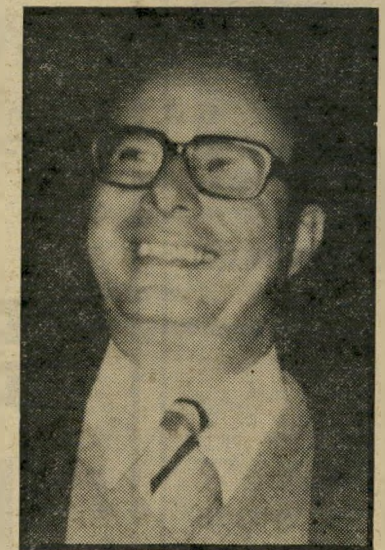
גילא ליליה וערפל

מדוע שונאים חברי-הכנסת את העיתונאים? לדעתי יש לכך סיבות עמוקות, הכרתיות ותת-הכרתיות. הצלחתו של חבר-כנסת תלויה בפירסומו באמצעי-התיק-