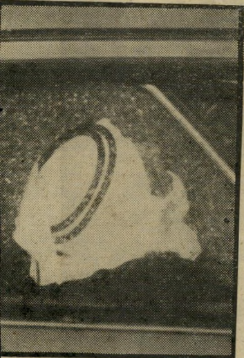
שייח' אבו-רביעה צוואה ?

ודוגמה: אחרי הקבורה הז' מין השייח' מוסה אל-עטאונה לשאת דברים את הנשיא יצחק נבון, את סגן ראש-הממשלה שימחה ארליך, את יו"ר מיפ-