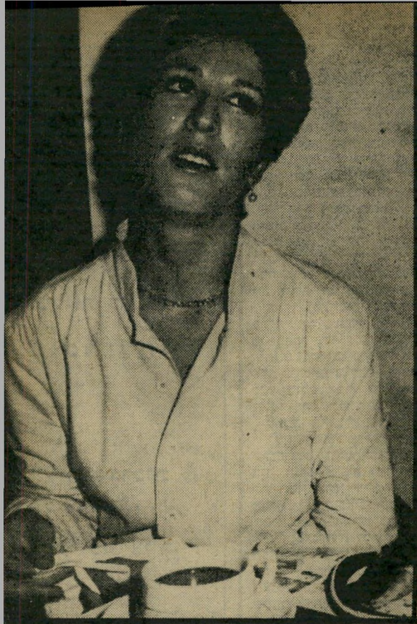
שדרנית מזור המישפט בעיצומו