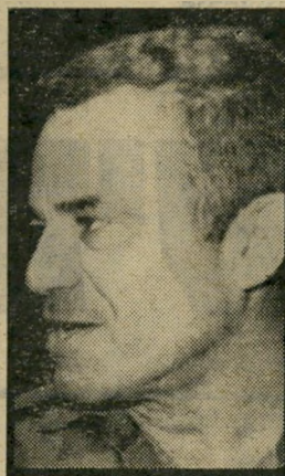
טמיר "לא זוכר!"