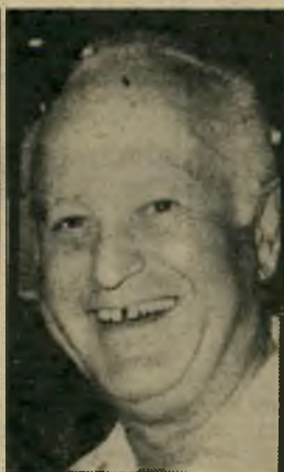
זנבר "לא הייתי בכלל!"

של 4-5 ימים, כולל לינה, במלון דר'קיסריה. היתה זו השתלמות במחשב כעור בניהול. לא הייתי בהשתלמות נוספות.