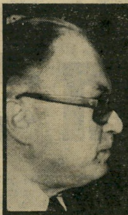
קוברסקי "הצטתי לשלם וטירבו!"