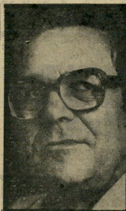
גפני "המלצתי לא להשתתף!"