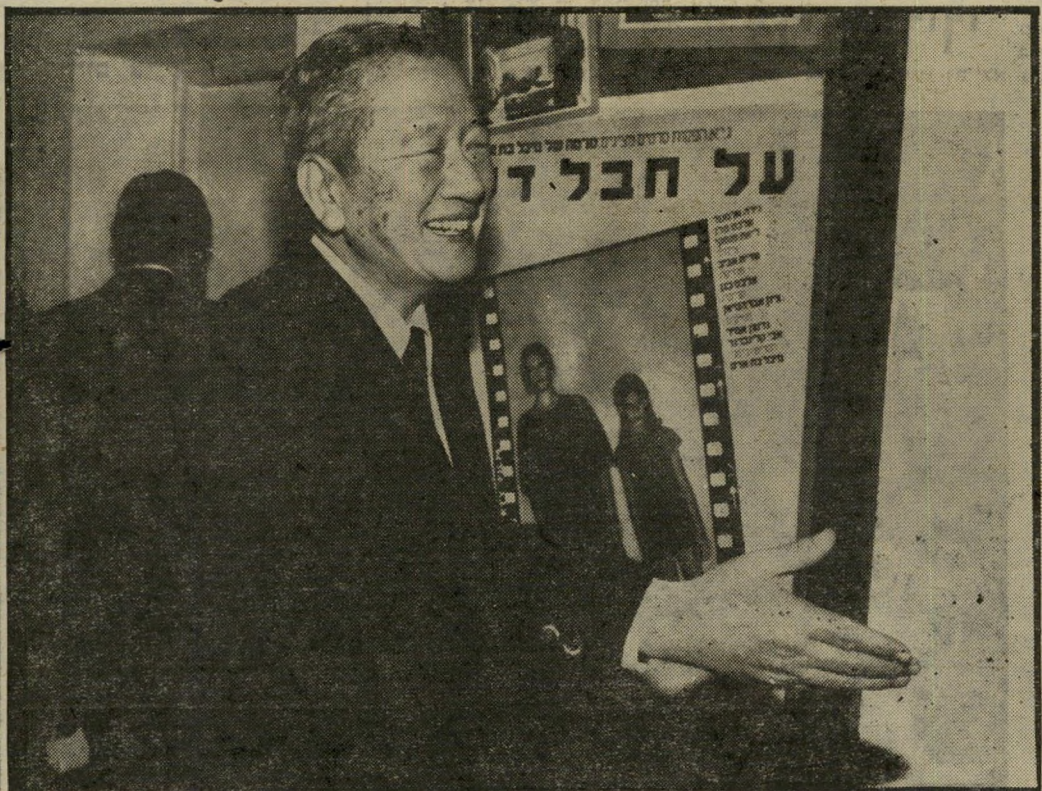
היפאני, שהוא סרט מילחמה, זכה לביקורות מצויי- נות בכל העולם. הלוחם הבכיר ביותר שנוכח ב- הקרנה היה חיים בר-לב, מי שהיה בעבר רמטכ"ל ועומד להיות שר-הביטחון הבא, בממשלת המערך.

"אני לי יודע למה חושבים שהרמטכ"ל שלנו אינו מתייחס ב- אהדה לשבויים. אני הייתי עד לכך שרפאל (רפול) איתן הציל שבוי מיצרי. זה היה בשנת '67, כאשר רפול היה אלוף-מישנה ו- מפקד חטיבת הצנחנים. הייתי ה-