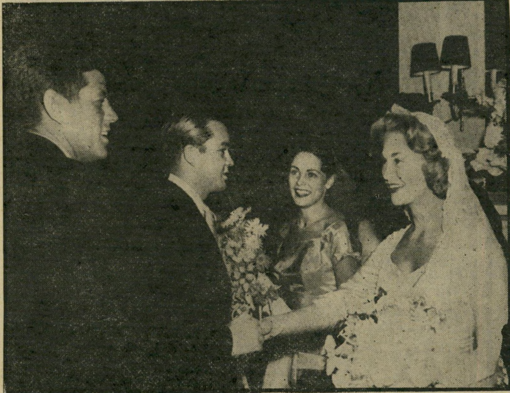
נובמבר 1958 — הכלה, ג'ואן בנט, מבורכת על-ידי גיסה, העתיד להיות נשיא, ג'ון ג'ואן עם ילדיה, טדי הבן וקארה, באחוזת המישפחה