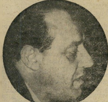
איוונכברג משתלט על המשק

הבורסה היא מכשיר לעשיית הרווחים שבהם קונים את דירות-הפאר ב-20 מיליון ל"י האחת ואת כל האביזרים המתלווים להן. רק חלק מכל הרווחים חוזר לבורסה. לא להשקעות בייצור, חס-וחלילה, אלא לעשיית רווחים נוספים, להגברת צריכת המותרות ולהאצת האינפלציה. אותו שר-אוצר, הורביץ, לא הטיל אפילו אגורה אחת של מס על הרווחים האלה. האם זה מקרי? האם זה מעיד על הרצון הטוב והכנות שייחסו אמצעי-התקשורת לשר ההולך? לדעתי זה מעיד על רצון לנצל את העובדים ולשרת קבוצות קטנות