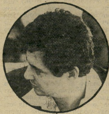
ארי'ל שר אוצר נבון?

ומייוחסות. העובדות בשטח מדברות בעד עצמן.