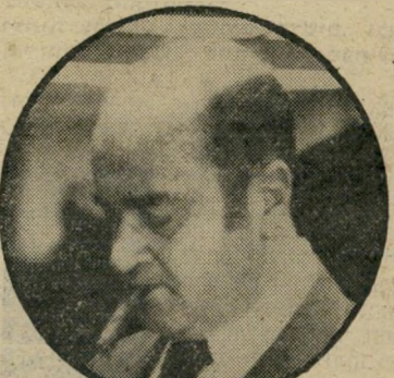
גינר חידון תורכי של אידיבי