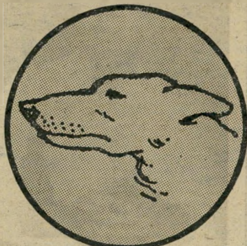
מבט פחדן אנזיים לאחור

בוודאי שכן. רבים סבורים, בטעות, שהכלב הינו תוקפן מטיבעו, ובשליכך באו חוקי העזר, כמו "מכת הכלבת" ותקנות המחסומים הרצועות. אבל לכלב, כמו לאדם, יש נפש ויש רגש. כשהוא מפחד, בדיוק כמו אנשים רבים, הוא מגיב בתוקפנות. וכמו בך אנוש הוא מפחד בגלל חוסר-ביטחון, בגלל רגש נחיתות, או כתוצאה מגירויים שאינם נעימים לו.