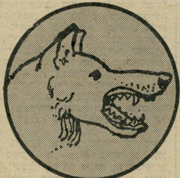
מבט תוקפן שיניים חשופות

כמוכן, את רוב הסימנים החיצוניים לפחד הכלב אפשר יהיה לזהות בכלבים