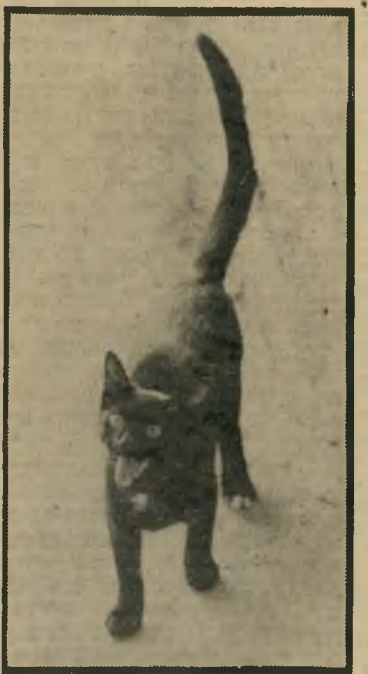
דון ז'ואן יועץ אהבה

היה היה חתול, זכר מאוד; בכל לילה היה מתעלס עם חתולותיו, ויללות העוגג שלו החרידו את השכנים משנתם. אחרי לילות רבים ללא-שינה טיכסו עיצה ומצאו: להוריד לו את הביצים. הורידו.