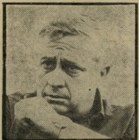
שר שרון גדר מסביב לחווה

אני קוראת את העולם הזה בקביעות כשנה. למרות התנג-