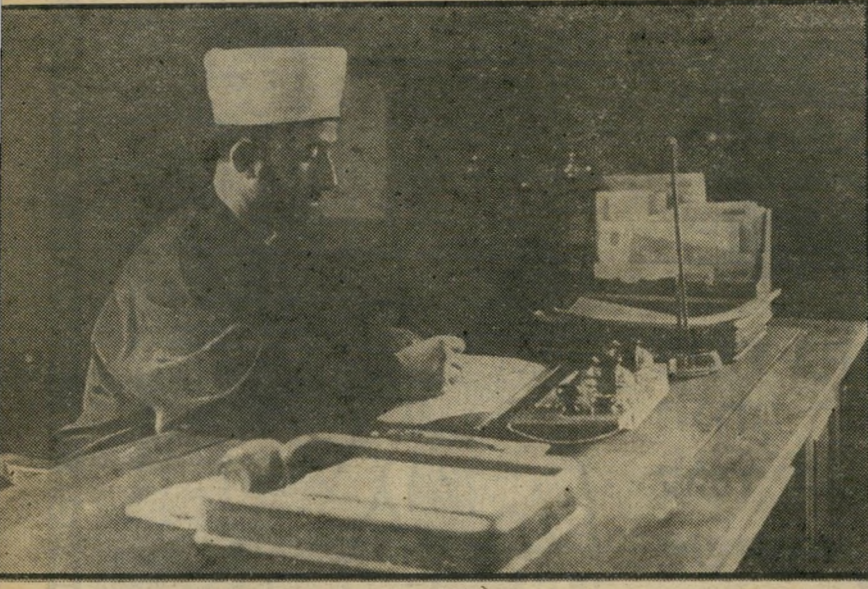
המופתי חג' אמין אל-חוסייני