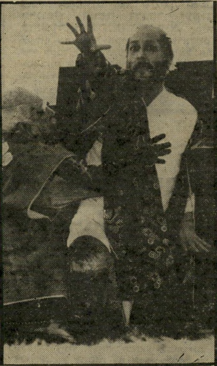
המצביא לפני מותו לא לגלות!

תלוש מכד העוקמות. צילום של ג'יי בור (זה פירושו השם היפאני של הסרט) הוא יישום של משל פרטי, שהשתל על-