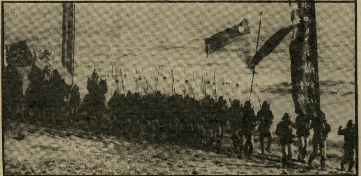
צבא צועד אל הקרב בפן שי המאה ה-16 פרסקות ענקיות

ידי קורוסאוה לתוך פרק חשוב ביותר בתולדות יפאן — הפרק של התמסדות ה-אימפריה ועליית שושלת האדו. בתקופה שבה מתרחשת העלייה גלחמות עדיין מישפחות אדירות-עוצמה על השליטה ב-ארץ, והמילחמות האינסופיות קורעות את המדינה לגזרים. מנהיגה של אחת המישפחות הללו נפגע על-ידי כדור תועה, דוור קא בשיא הצלחתו. בשעת הגסיסה הוא מורה למצביאיו שלא לבשר לעולם על מותו, לשמור את הידיעה בסוד ולהעמיד תחתיו כפיל במשך שלוש שנים. כל זאת,