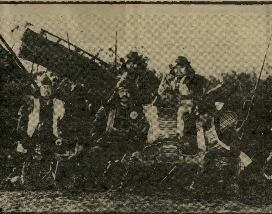
המצביא-הגיבור מפקד על הקרב