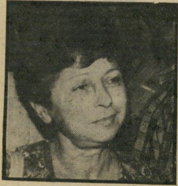
בעלת-מישרד קול העדה

פתיחת מישרד חדש בתקופת-שפל ל-מישרדי-הנסיעות הקיימים נחשבת כצעד נועז ביותר בשוק-הנסיעות בישראל. מישרד-הנסיעות העומד בחלקו למכירה, הוא קלאסיק טורס, ברחוב הירקון בתל-אביב, שהיה בבעלות שני שותפים,