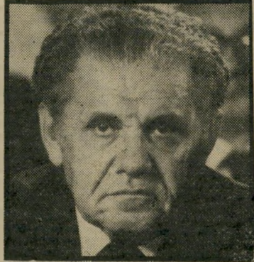
עורך-דין צדוק לעקוף את המיכרז

את האפשרות שהקרקעות בירושלים יירכשו על-ידי חברות זרות, שיהיו בבעלות הקבלנים הישראליים. החוק בישראל מאפשר לתת קרקעות של מינהל מקרקעי ישראל לחברות זרות, המתכוונות לבנות בארץ.