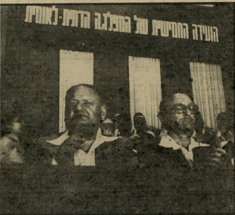
עסקנים ורמוס ומי-נתן תארי בחירות

א ני לא איומתי אף פעם לפרוש מהמפד"ל, אמר השבוע שרי-החייך, זבולון המר, למנהיג מיפלגתו, הדי"ר יוסף בורג, בשיחה שהתנהלה ביניהם בלישכתו של בורג.