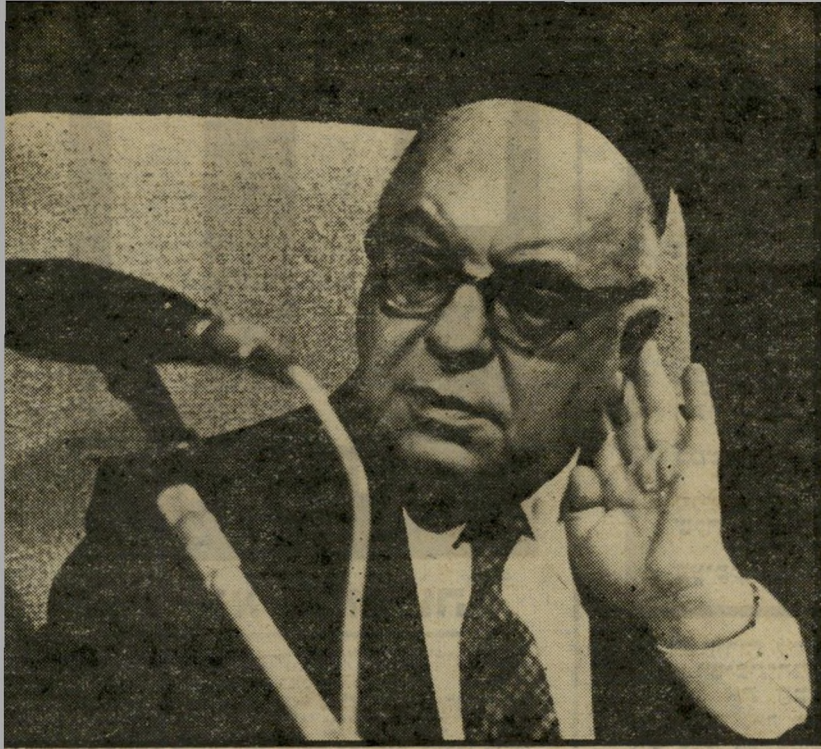
מנצח בורג לשמוע ולחייך