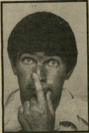
קורא אנון שלטים ברורים

במדינות רבות בעולם נוהגים לציין על האוטובוסים הציבוריים, בשלטים בולטים וברורים, את יעד