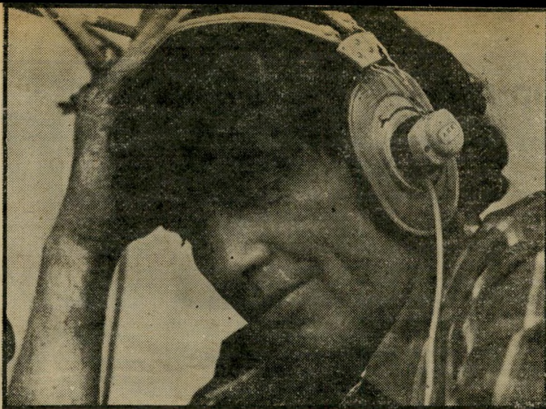
מנהל שגריר שיח לוחמים

העילה למאבק זה: ציוד-הטלוויזיה הי חדש, מצלמות אלקטרוניות אי-אן-ג' ניידות, מצלמות וידיאו לכתבים (בניגוד ל-מצלמות-החוף, המצלמות כיום בסרטי פילם ול-רברסל). מצלמות אי-אן-ג' נועדו לצימצום כוח-האדם בצוות הטלוויזיה ל-כדי כתב ואיש-צוות, שיצלם ושיקליט ברומנית, את בעיית צימצום הצוות לא הצליחו לפתור עדיין באנגליה בבי-בי-סי ובטלוויזיה המיסחרית שם. למרות שמצלמות אלקטרוניות עשויות לחסוך גם סכר מיעוט בחומרי-גלם לצילום, לא ניתן ל-נצל את יעילותן באיים הבריטיים.