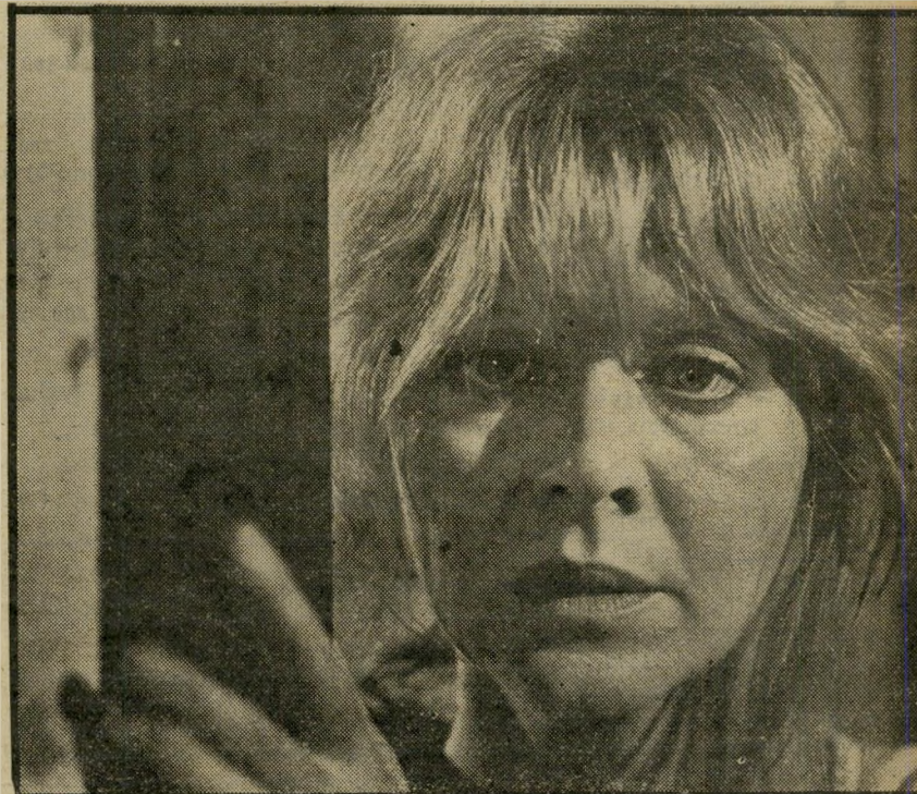
מדינדה רילון בתפקיד אם הידך הזוכה למיפגש מן הסוג השלישי האטפקט הדתי של החוויה

הצופה הממוצע היה יותר מבוזבל. הוא לא הבין מה זה בדיוק „מהדורה מיוחדת.“ והוא חשב שמדובר בסרט חדש או בסרט אחר, ולא מצא אותו. התוצאה: הכנסות הקושה באמריקה היו פחותות מן המצופה.