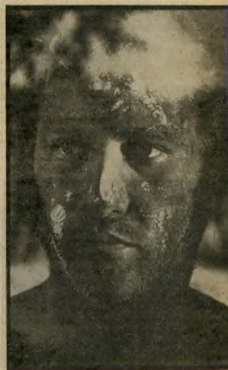
שחקן דרייפוס פיוט קולנועי

באירופה, שם טרחו מחלקות-הפירסום להסביר את הכוונה של שפילברג, נמצא הקהל שלו נועד הסרט, ואכן התוצאות הרבה יותר משיבעות רצון. אולי משום שבאירופה, יותר מאשר באמריקה, יש נטיה לראות בקולנוע יותר מאמצעי-בידור