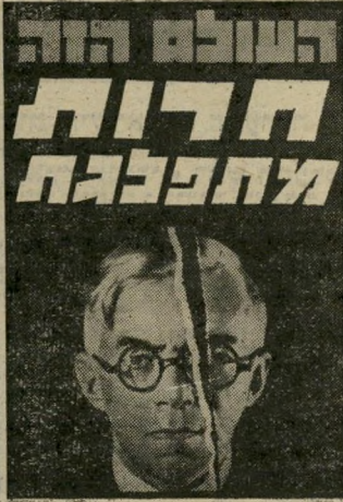
"העולם הזה" 1534 קרע בצמרת

לישכה יכולה למדוד את מיספר האנשים הנעדרים מן המדינה פרי קי זמן מוגדרים מבלי יכולת לק בוע סיבות ההיעדרות וכוונות ל עתיד. הלישכה מפרסמת נתונים אלה לפי התפלגות של הנעדרים. הנתון של 68,500 ישראלים שר יצאו בינואר 1979 לחו"ל ועדיין לא חזר