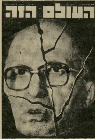
"העולם הזה" 2263 קרע בצמרת

אלה שאינם טורחים לעמוד בקרי טריון שקבעו כותבי השנתון להגי דרת יורד: אדם שנעדר מן הארץ ארבע שנים ברציפות". ההיפך הוא הנכון: מאומדני האוכלוסייה השנר תיים מופחתים, מדי שנה, אותם תושבים שנעדרו שנה שלימה אחת מן המדינה. אין ללישכה המרכזית לסטטיסטיקה קריטריון להגדרת יורד: הי