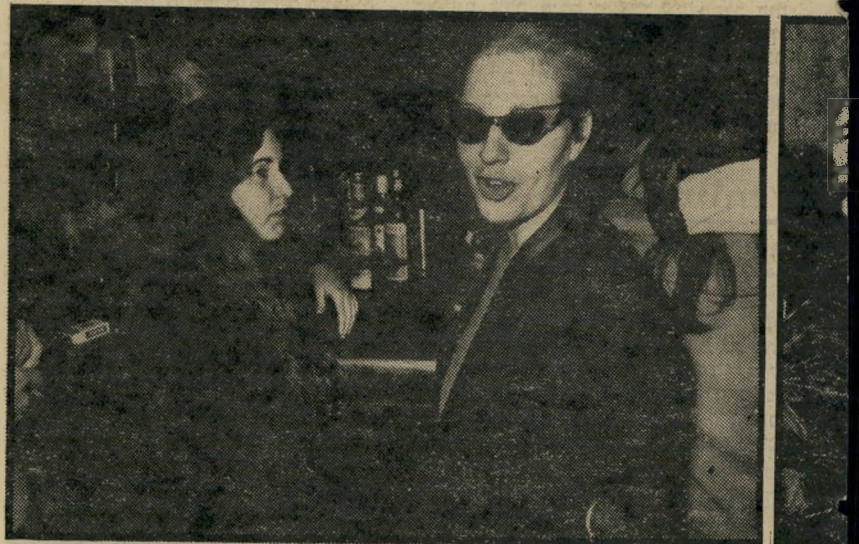
מתכוננת צעירה אחת שכחברתה המבלה איתה במועדון. "אני מסתרת מאחורי משקפי השמש שלי כדי שלא יראו כמה שחור לי בנשמה." משמאל: גילה המכריזה: "יש לי גוף של כוכבת קולנוע."