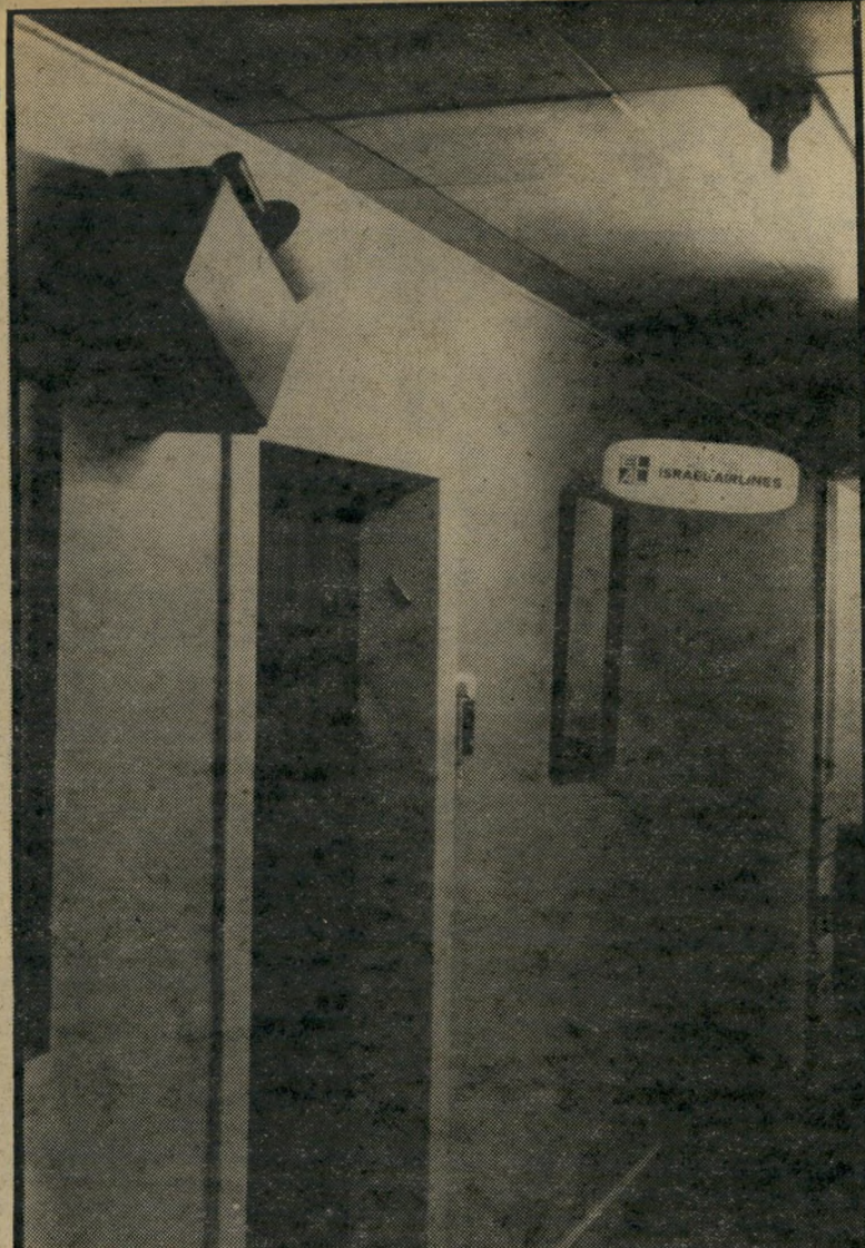
שפת מת דלת מישרד אל-על. משמאל: המצלמה במעגל סגור; מימין: פעמון ואינטרקום. כאשר המראות שמול הדלת (שאינן נראות בתמונה) אינן יציבות, כפי שהדבר קורה פעמים רבות, נוצר שטח מת.