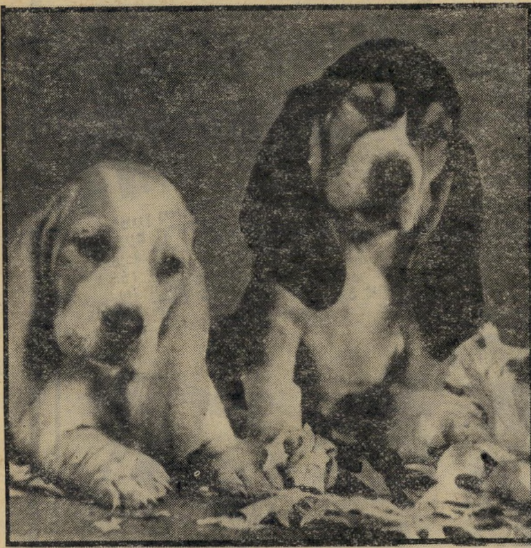
כלבי באסט (ראה : אימוץ) הצליעה פוגמת במוראל

לא יכול להתלונן שהוא מרגיש את הקור וזחל לו לתוך העצמות, אבל מבט על צורת הגפיים שלו יגלה את הצרה. ואין דבר מיסכן יותר מכלב שובב ועירני המתחיל לצלוע או מתקשה לטובב את הראש. אפילו הנהגים שלנו מתרשמים ממראהו המעורר רחמים של כלב צולע. ומאיטים את נהיגתם, וכאשר אין זה מי פציעה או מחתך, וזה מתחיל להיסחב על פני שבועות, ובגיל מבוגר, נראה כי זהו ראומטיזם כרוני. גם הכלב מודע לכך, שגדולתו בהליכתו הנאה ובכוסר הריצה שלו, ואין כמו פגיעה בגפיים כדי להוריד לו את המוראל.