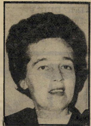
שופטת ונשטיין על המדינה לשלם

אם לא מספיקות כל הצרות הללו, האשה כל פעם שהוגש היה רב, היתה הרישה רצת למישטרה ומתלוננת כי בעלה פורץ, גונב ועובר עבירות אחרות.