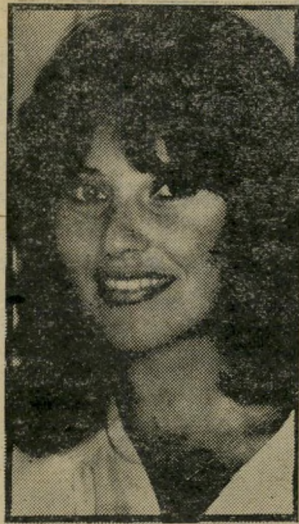
בעלת-מדור דנין נראית לגמרי לא רע