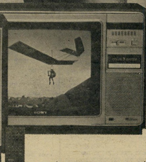
לבחירתך מספר דגמים חדישים בגדלים שונים: