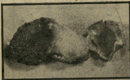
בננת, בננת, בננת, בננת, בננת הסינית

שופכים בפנים כוס אחת קמח רגיל. על זה מוסיפים חצי כוס קורנפלור. על זה מוסיפים שלוש כפיות סוכר. על זה מוסיפים כפית אחת גדושה אבקת-אפיה.