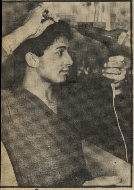
כר עם עצמו צורה של כיוור

"זה מה שמעניין אותי כיום. אבל אני לא מצטער על מה שעשיתי בעבר. אני רואה את מיקצוע האסקורט כדבר טבעי לחלוטין. גם אני, אילו הייתי מגיע לעיר זרה, הייתי שוכר לעצמי בן-לוויה צעיר ונחמד, כדי לבלות עימו את הערב. מדוע לא?"