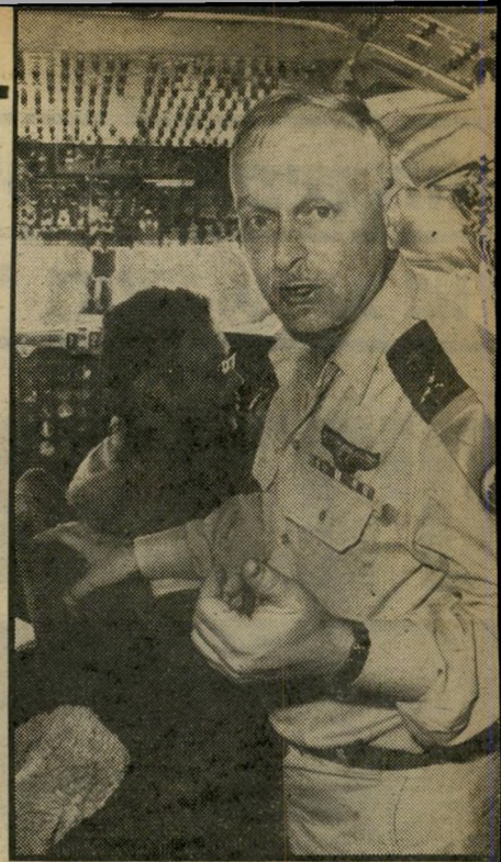
מפקד-חיל עיברי סחף ותעלול

דובר צה"ל מכחיש גם את הטענה שלפיה ניבנו יותר וילות מהצרכים.